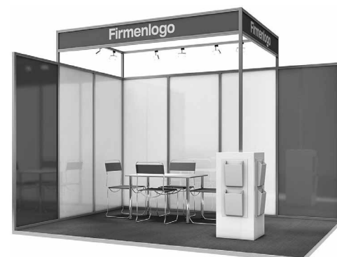
Abbildungen: Musterzeichnung Eckstand 12 m 2